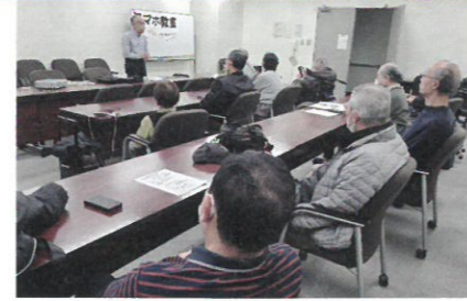
←真剣に講師の説明に聞き入る参加者

2月10日(土) 午前10時より大阪市立社会福祉センター第2会議室で、スマホ教室を開催しました。 スマホの機能を使い、外国語の翻訳機能を使うなど、日ごろさわることのない機能を講師の方から教えていただきました。 10名の方が参加し、はじめて使う機能を熱心に勉強されていました。