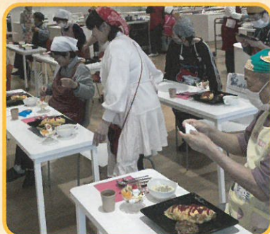
(写真:美味しく盛り付け、ガイドさんと一緒にいただきます)➡

12月3日、ハグミュージアム(大阪市西区)にて「料理講習会」を開催しました。今回のテーマは「大人のお子様ランチ」。男性も女性も初挑戦の人も、みんなで協力しあい、チーズインハンバーグにオムライス、コンスープやプリンパフェを作りました。 参加者からは、「ハンバーグをこねるのが楽しかった」「ちょっとしたコツを教わり参考になった」「皆でワイワイ作れて楽しかった」など様々な感想が寄せられました。 今後も、韓国料理等、色んな国の料理や文化に触れていきたいと考えています。