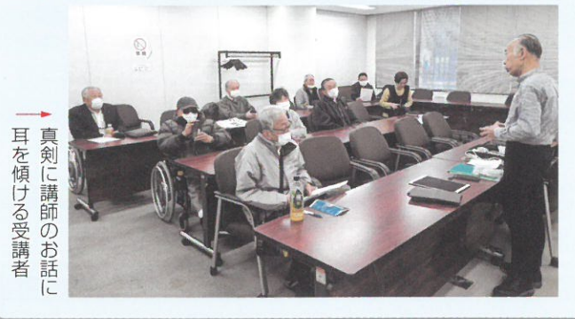
真剣に講師のお話に耳を傾ける受講者

2月15日(土)午前10時より大阪市立社会福祉センター第2会議室で、スマホ教室を開催しました。スマホの機能を使い、外国語の翻訳機能を使うなど、日ごろさわることのない機能を講師の方から教えていただきました。 参加者は、はじめて使う機能を熱心に勉強されていました。