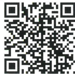
中央会館HP二次元コード