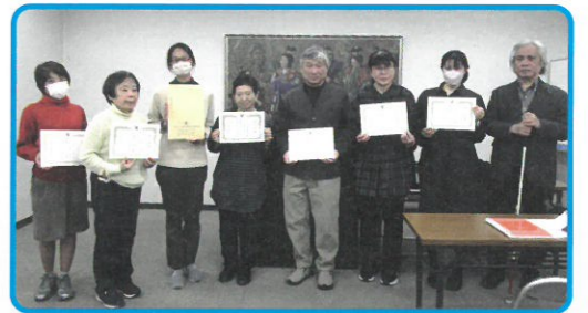
(集合写真:修了証書を手し、講師・担当理事と並ぶ受講生)

※詳細は大視協ジャーナル6月号で掲載いたしますので、皆さまのご連絡をお待ちしています。