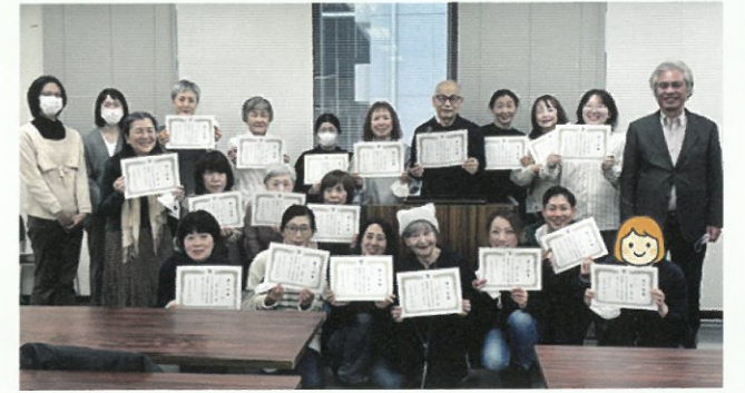
集合写真:修了証書を手し、大阪市福祉局担当者・講師・担当理事と並ぶ受講生

閉講式では、大阪市福祉局から19名の修了生一人ひとりに修了証書が授与されました。次回の「第99回点訳奉仕員養成講座」は、8月20日(木)から開講予定です。